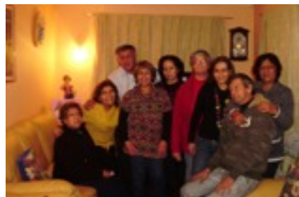
Clase en Quinta de Tilcoo